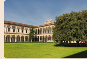
Il cortile d'onore dell'Università Statale di Milano

Un corso per diventare il trait d'union tra l'inventore e il brevetto