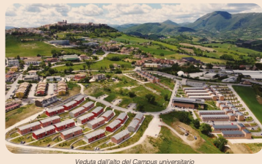
VEDUTA DALL'ALTO DEL CAMPUS UNIVERSITARIO

edifici pubblici e privati. La Scuola di Bioscienze e Medicina Veterinaria propone il master "Cardiologia veterinaria", con un percorso formativo unico sul panorama nazionale, che ha l'obiettivo di fornire al medico veterinario le basi scientifiche e pratiche per affrontare la diagnosi, la terapia e chirurgia delle patologie cardiache del cane e del gatto. La Scuola propone inoltre da anni con successo il master in "Management aree e risorse acquatiche costiere" e quello in "Nutrizione Nutraceutica e Dietetica Applicata". L'offerta formativa completa dei master Unicam per l'anno accademico 2022/2023, è consultabile alla pagina web: https://www.unicam.it/laureato/didattica-post-laurea/master . Oltre ai corsi di master, che hanno durata almeno annuale, vengono proposti da Unicam altri corsi di perfezionamento o di formazione professionale finalizzata di più breve durata, che in alcuni casi non richiedono la laurea come titolo di accesso, e sono consultabili alla pagina: https://www.unicam.it/laureato/didattica-post-laurea/corsi-post-laurea-e-perfezionamento .