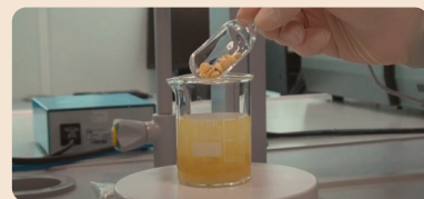
Particolare di un laboratorio di ricerca Unicam

per la gestione generale dell'atleta e dei team sportivi, soprattutto per l'high performance. Unicam inoltre dispone di impianti sportivi innovativi e funzionali che permettono una completa e adeguata preparazione anche ad atleti professionisti. I nuovi corsi proposti per il 2022-23 si aggiungono ai master di consolidato successo che da molti anni caratterizzano l'offerta formativa Unicam, come ad esempio il master di II livello "Manager di Dipartimenti Farmaceutici", giunto alla ventunesima edizione e punto di riferimento nazionale per la formazione manageriale dei farmacisti ospedalieri, il master in "Medicina estetica e terapia estetica", erogato anche in lingua inglese ed in diverse sedi, in Italia e all'estero. Entrambi proposti dalla Scuola di Scienze del Farmaco e dei Prodotti della Salute. Anche la Scuola di Architettura e Design, alle novità affianca master di consolidata esperienza, come quello in "Ecosostenibilità ed Efficienza Energetica per l'Architettura", dove si forma un profilo professionale specializzato nel consumo e nell'efficientamento energetico di